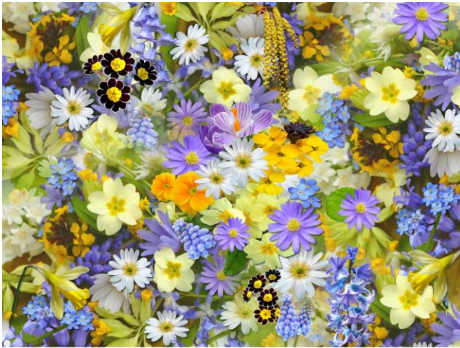
[ Die Vielzahl der Pollen machen es jedes Jahr schwerer den Erreger zu finden ]